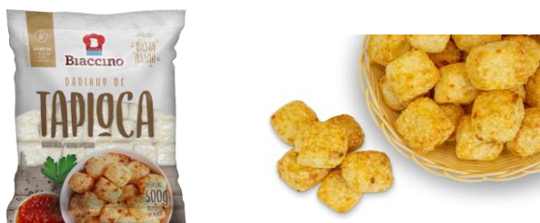
Ilustração do Produto