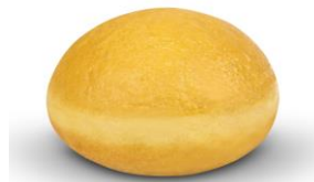
Ilustração do Produto